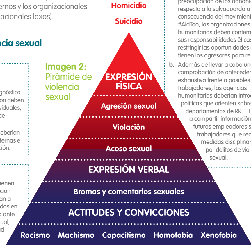
Imagen 2: Pirámide de violencia sexual